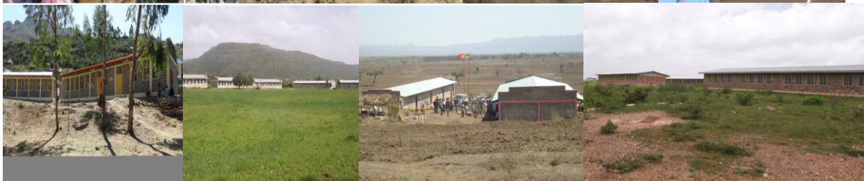
ብማልት ዝተሃንፃ 670 ቀዳማይ ብርኪ ኣብያተ ትምህርት